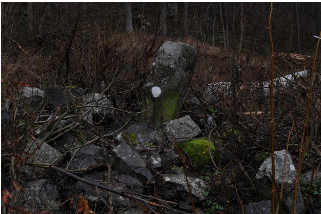
Femstenaröset nedan Halleberg, Skogsvägen. Röset är skadat.

Viktigare gränsmarkeringar skulle bestå av sten som inte förgjordes så lätt. En gräns skulle rösas. Ett större gränsrös kallas Femstenarös, vilket skulle bestå av fem runda stenar som var tre alnar höga och nio alnar i en cirkel. I mitten av femstenaröset finns stenen som benämns Hjärtstenen och runt den var det fyra mindre hörnstenar. Runt Hjärtstenen var från början