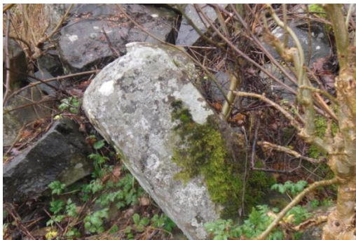
En visarsten vid femstenaröset nedan Halleberg, Skogsvägen.